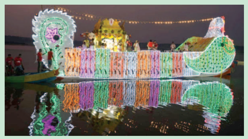
ఆదివారం భద్రాచలం గోదావరిలో వివారిస్తున్న రామయ్య తెప్పోత్సవం దృశ్యం 3