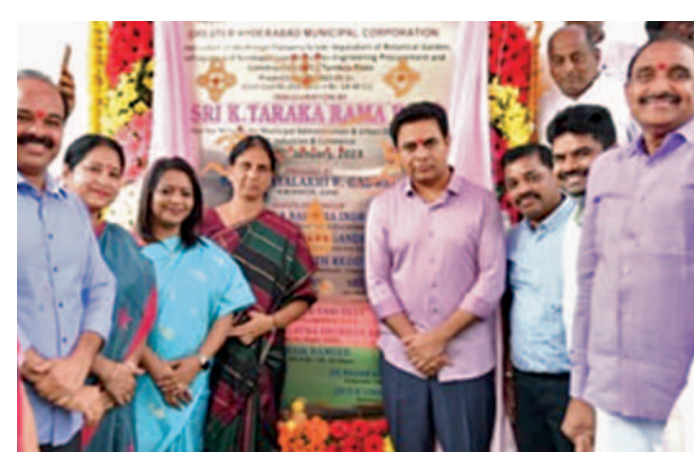
ఆదివారం కొత్తగూడ పైడవరను ప్రారంభిస్తున్న మంత్రులు కెటిఆర్, సచిత్ తదితరులు

నగరంలో 50 యేళ్లకు సరిపడే మంచినీటి వ్యవస్థ ఏర్పాటు నూరుశాతం మురుగునీటి పారుదల: మంత్రి కెటిఆర్ రూ. 263 కోట్లతో నిర్మించిన కొత్తగూడ పైడివర ప్రారంభం