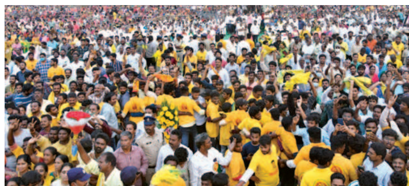
గుంటూరులో ఆదివారం టిడిపి సభలో తోక్కినలాట జరిగిన దృశ్యం